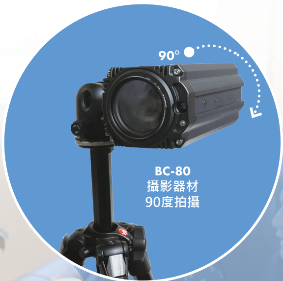
BC-80 攝影器材 90度拍攝